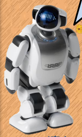
PALRO (富士ソフト株式会社)

主催：総合リハビリテーションセンター福祉のまちづくり研究所 電話：078-927-2727 (内線3736) ※お問い合わせは、月～金曜日の9時～17時の間にお願い致します ※詳しい展示品については、順次ホームページにアップしています